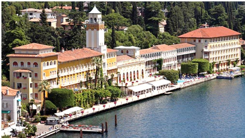
Il Grand Hotel di Gardone Riviera - Sede Congressuale

Giugno è anche – se non soprattutto – il mese del Congresso distrettuale . Il Rotary International vuole che tale appuntamento offra l'opportunità di riallacciare amicizie sopite e di farne di nuove, di incontrare relatori interessanti e di ascoltare discussioni su argomenti rotariani e non. È quello che lo staff ed io abbiamo cercato di fare, attenendoci al suggerimento del Rotary International che esige anche il rinnovamento del modo di fare Rotary , in linea con i mutamenti della società in cui viviamo.